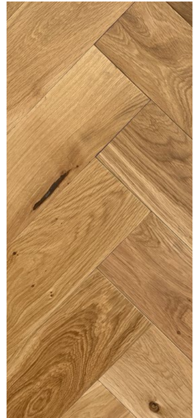
22 / 6 × 120 × 840 mm Fischgrätmuster glatt, extrem matt farblos geölt