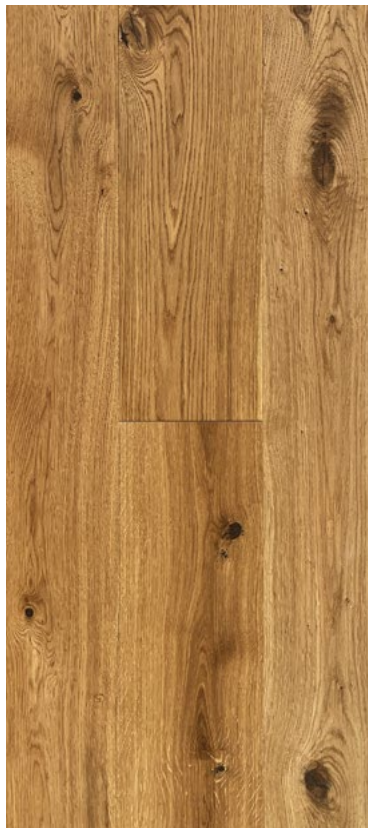
22 / 6 × 190 × 2130 mm gebürstet , extrem matt farblos geölt