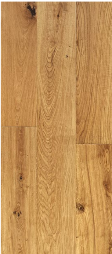
22 / 6 × 190 × 2130 mm handgehobelt , extrem matt farblos geölt