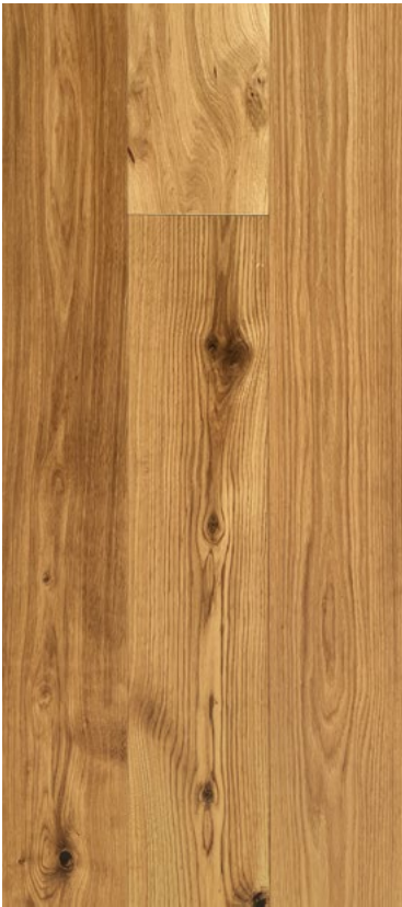
22 / 6 × 190 × 2130 mm glatt, extrem matt farblos geölt