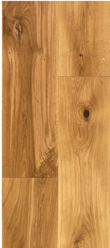
22 / 6 × 240 × 2130 mm glatt, extrem matt farblos geölt