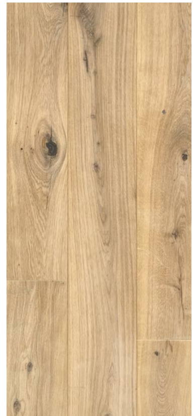
22 / 6 × 190 × 2130 mm reaktiv gefärbt , extrem matt neut- rino geölt (Absolute)